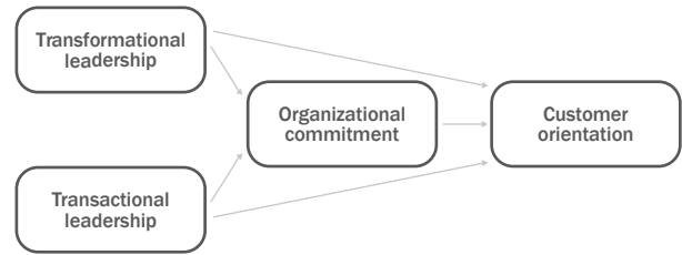
Figure 1. Research model.

This model shown was to indicate effects of managers' leadership types on customer orientation in the beauty industry. Organizational commitment was used as a parameter.